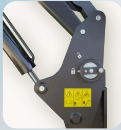
2 Attelage automatique de tracteur - Chargeur EURO 2.0