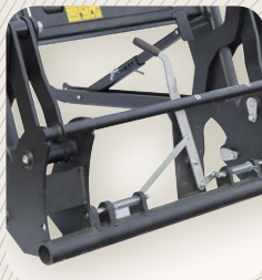
6 Enganche automático de implemento EURO