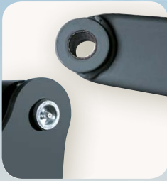
1 Todas las articulaciones van encajadas y con casquillos anti-fricción