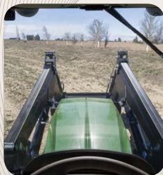
9 Visibilidad óptima integrado