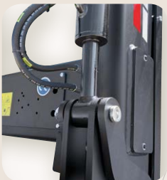
5 Cruceo ovalado reforzado