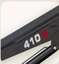
8 Sistema paralelográfico integrado