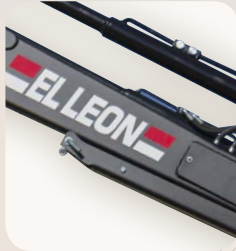
4 Patas integradas en el brazo