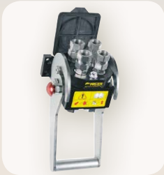
3 Placa multienchufes FASTER de serie