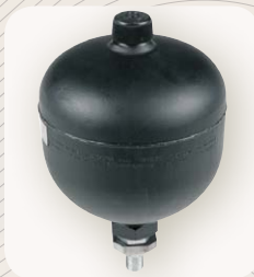
7 Sistema de amortiguación (opcional)